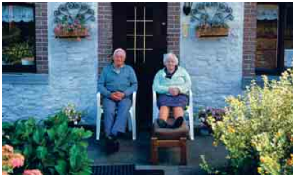
Acht op de tien ondervraagden zijn eigenaar van een woning.