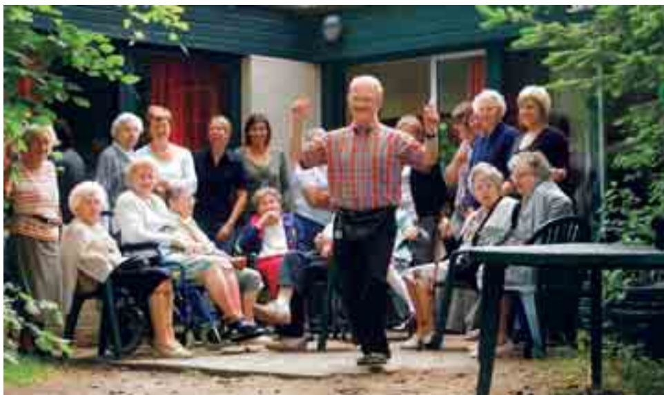
Senioren hechten veel belang aan een sterk sociaal netwerk.